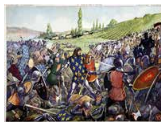
Tableau n°19 : Jean le Bon à Poitiers Le courage face à l'adversité