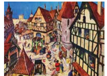
Tableau n°16 : Une ville au XIII e siècle La ville archétypale