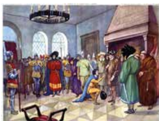
Tableau n°21 : Jeanne d'Arc à Chinon Un destin national