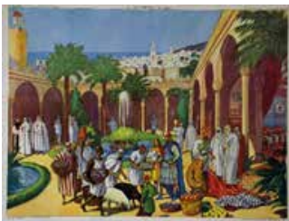
Tableau n°13 : Les Chrétiens en Orient L'Orient idéalisé