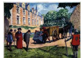
Tableau n°24 : Louis XI à Plessis-lès-Tours La légende noire