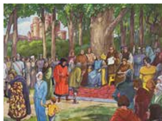
Tableau n°18 : Saint Louis rend la justice Le roi justicier idéal