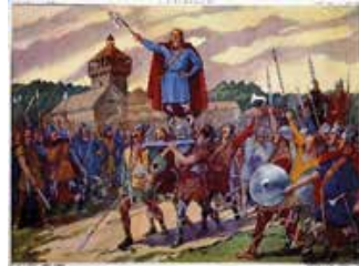
Tableau n°6 : Clovis proclamé roi Le chef rassembleur et providentiel