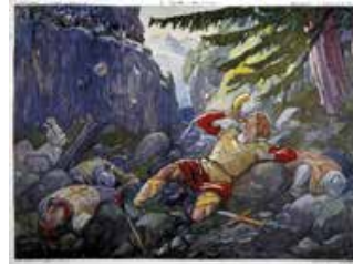
Tableau n°7 : Roland à Roncevaux Le prix de la trahison