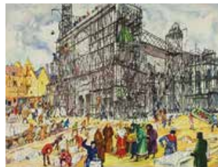
Tableau n°15 : Une cathédrale en construction Un chantier fédérateur