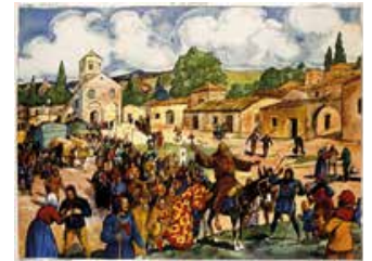
Tableau n°12 : La Croisade L'unité des chrétiens