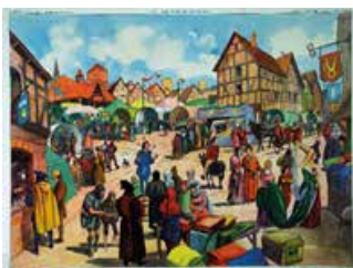
Tableau n°17 : Une foire au Moyen Age L'importance du petit commerce