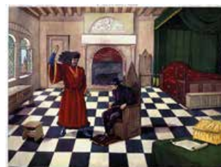
Tableau n°23 : Louis XI et Charles le Téméraire Louis XI ne se laisse pas impressionner