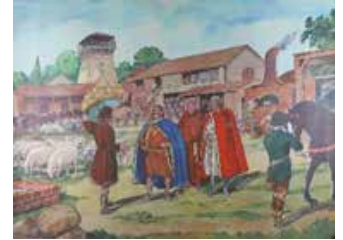
Tableau n°8 : Charlemagne visite une de ses villas Un chef attentif