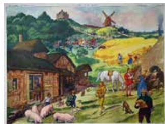
Tableau n°14 : Seigneurs et paysans Valeureux paysans