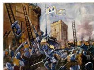
Tableau n°22 : Jeanne d'Arc à Orléans Le courage de l'héroïne