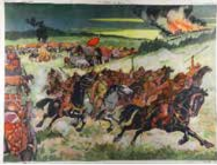
Tableau n°5 : Un camp de Huns Barbares = désordre