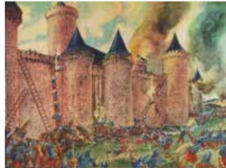
Tableau n°10 : L'attaque du château-fort Une vision dix-neuviémiste