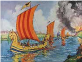
Tableau n°9 : Les Normands Vikings = pillages