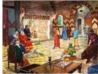
Tableau n°11 : La vie au château-fort La question du confort